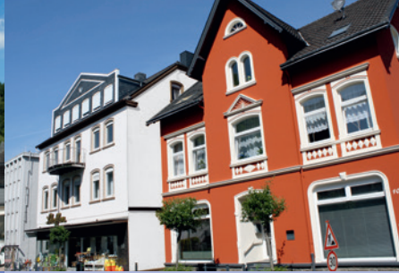
Haus Steffen / Haus Müller