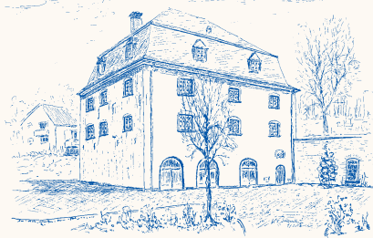
Burghaus